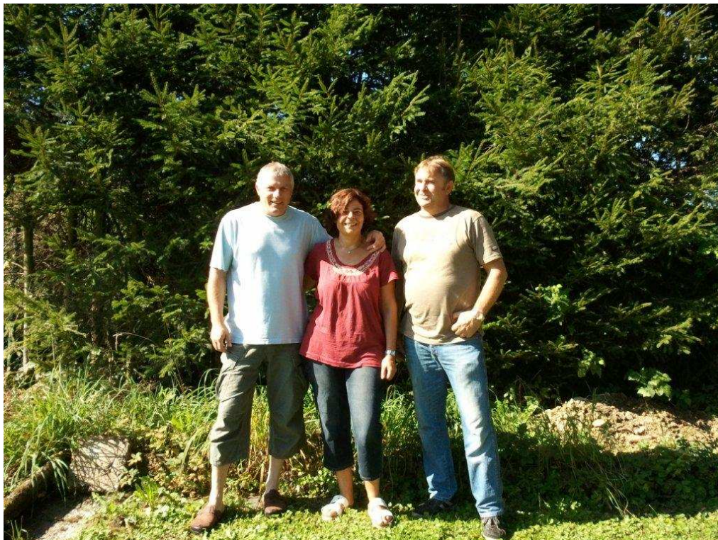
die 3 Teilnehmer der Vereinswanderung 2011

Unterwegs in einer kleinen Kapelle (für den Schützenverein) betend wanderten wir frohgemut durch den sich langsam lichtenden Morgennebel und kamen schließlich nach etwa 1,5 Stunden bei strahlendem Sonnenschein im Garten bei Bernd an.